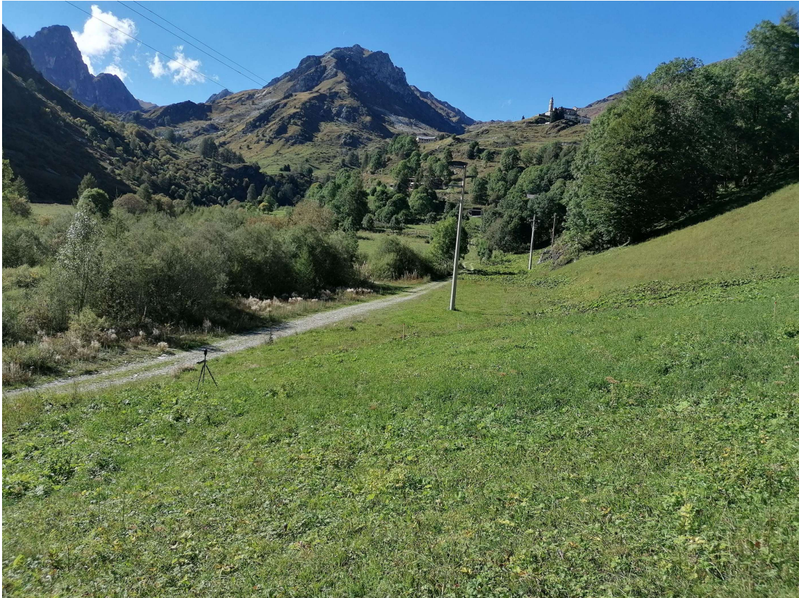
Foto 4 – Vista dell'area del nuovo depuratore, a fianco della sede della pista sterrata.