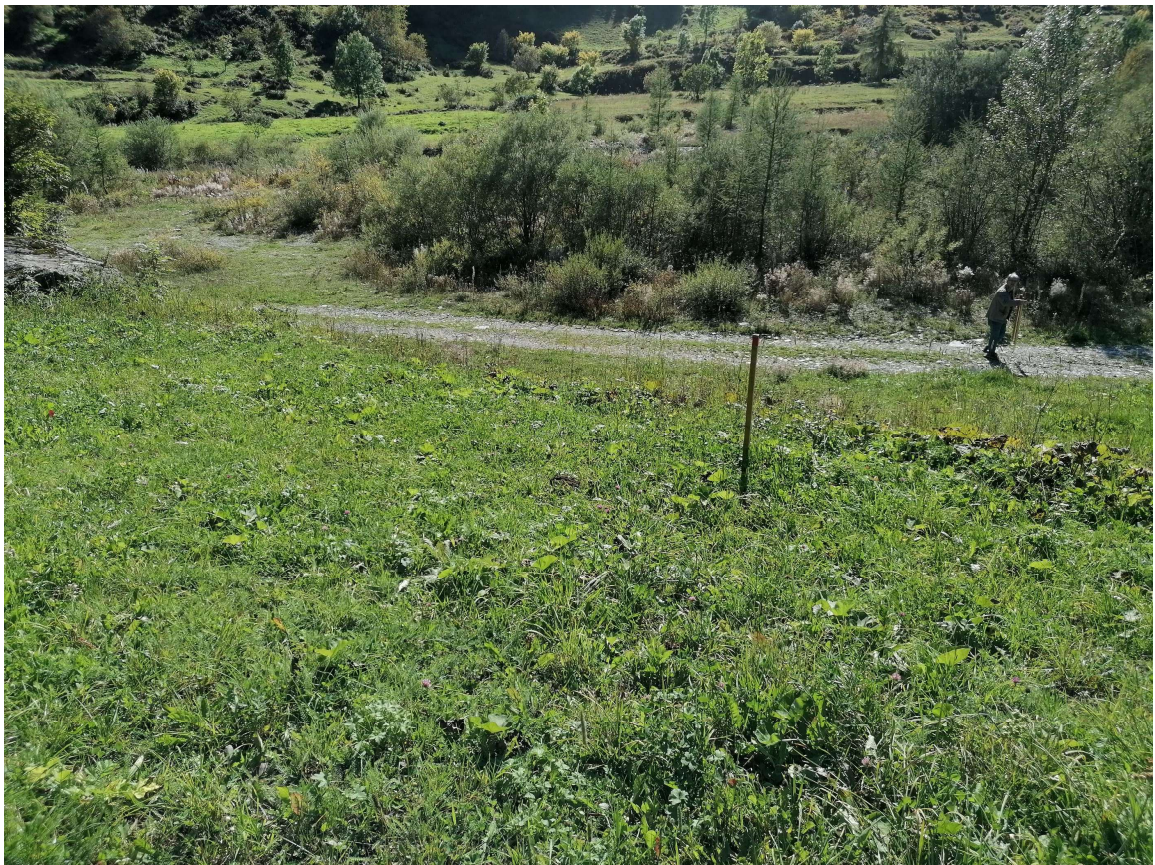
Foto 5 – Vista del punto in cui sarà inserito il nuovo depuratore.