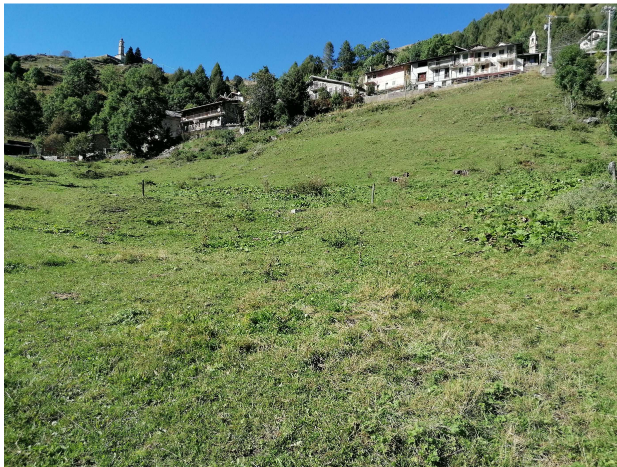
Foto 1 – Vista del pendio da cui proviene la condotta esistente della rete interna alla Fraz. Chiappi.