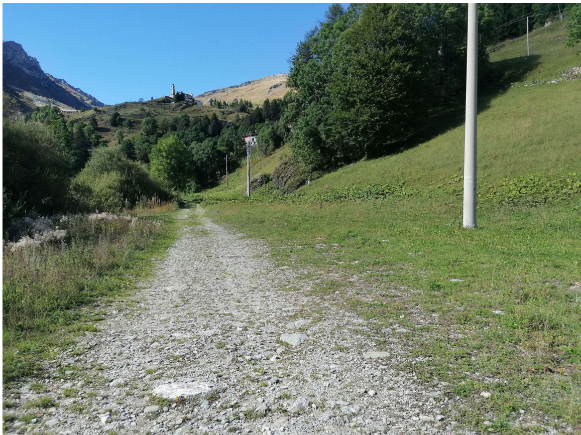
Foto 3 – Vista verso monte della pista lungo la quale sarà posata la condotta fognaria.