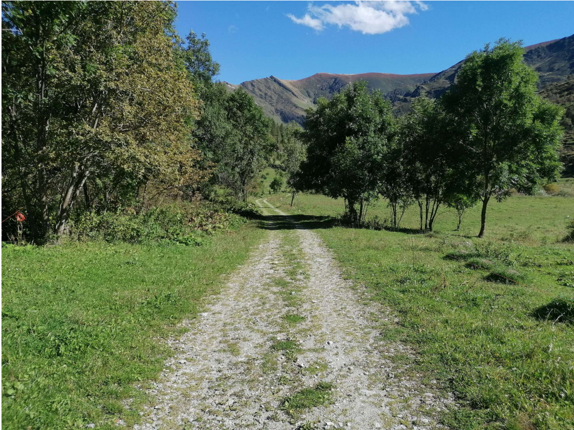
Foto 2 – Punto d’inizio della pista sterrata interessata dalla posa della condotta al nuovo depuratore.